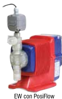
EW con PosiFlow

Simple Calibración - En el modo calibración el usuario solo necesita arrancar y parar la bomba, ingresar el caudal calculado y la bomba calibra el caudal por impulso.