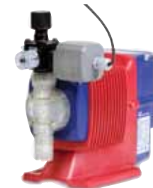
EW con válvula multi-función y PosiFlow

Verificación de la dosificación - EW está equipada con 3 modos pre-programados para aceptar el verificador de dosificación PosiFlow, el cual provee un pulso de realimentación a la bomba para verificar el cebado y una dosificación correcta. Dependiendo del modo, el usuario puede programar la bomba para que se detenga, para que continúe funcionando y/o para que envíe una alarma basada en la información del PosiFlow.